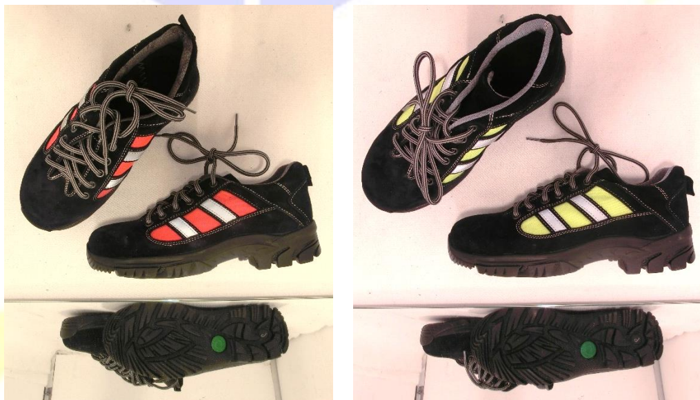
Foto di 2 di 15 possibili varianti colore

Nota: Nella documentazione tecnica sono riportati una più dettagliata descrizione del DPI (materiali, lavorazione, fotografie o disegni), prestazioni, funzioni protettive e livelli di protezione offerti, elementi di conformità ai requisiti di base e supplementari. Pertanto la Documentazione Tecnica è parte integrante del presente Certificato, che deve essere conservato dal fabbricante per essere esibito, su richiesta, all'organismo di controllo o all'amministrazione di vigilanza.